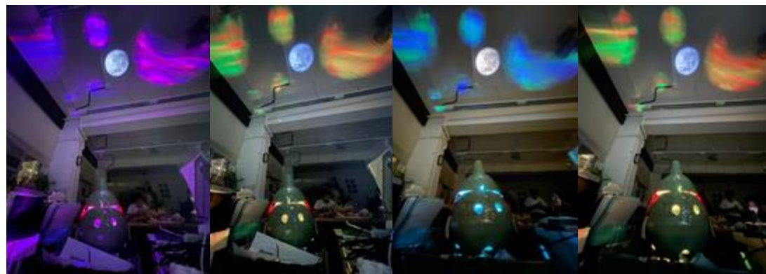
↑ 探索光影效果：陶器葫蘆的鏤空花紋製造出半月形狀投射於天花板