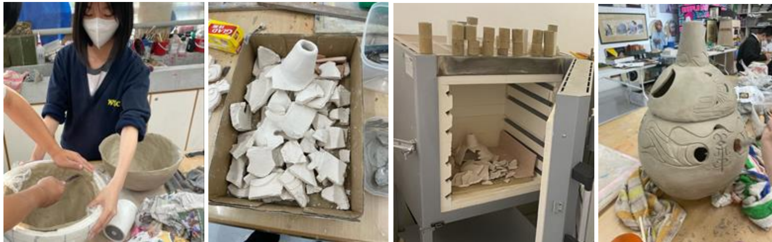
↑ 探索陶泥乾濕度、負重能力、物料特性；在過程中經歷多之失敗和嘗試