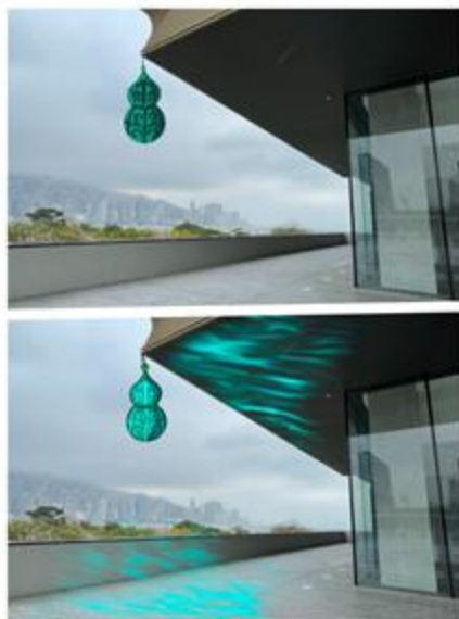
↑ 設計圖及模擬圖以 procreate 繪畫