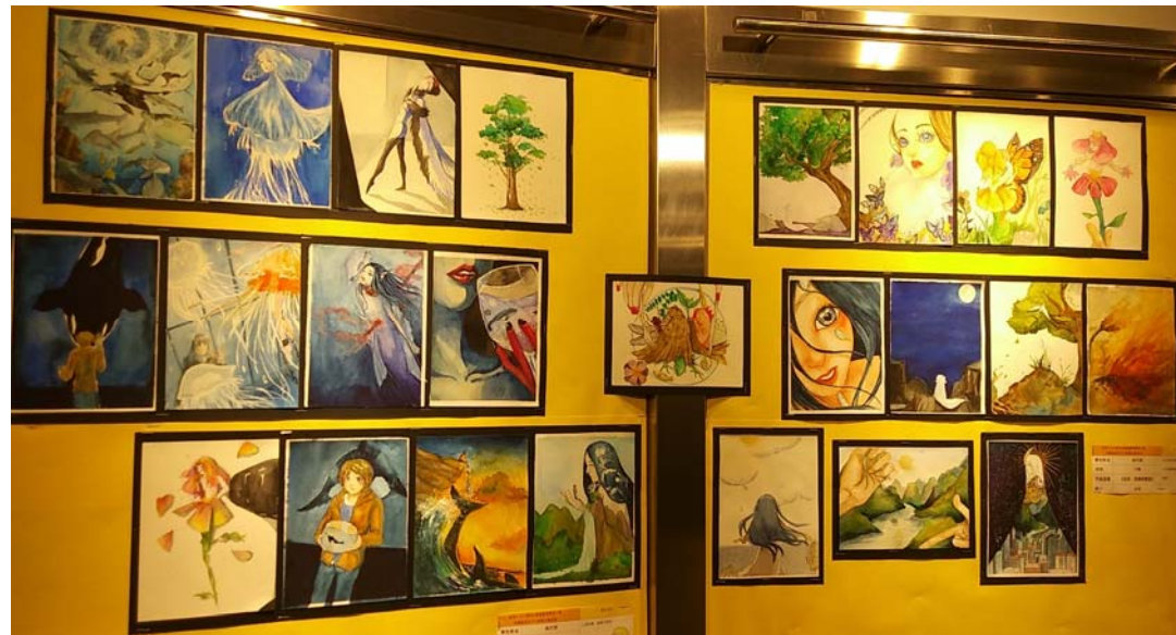
作品 3 自然發展與歷程 水彩紙本 13.7 x 18.6 厘米 (24幅)