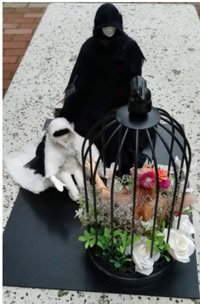
作品 2 自然的請求 混合媒介 42 x 30 x 28 厘米