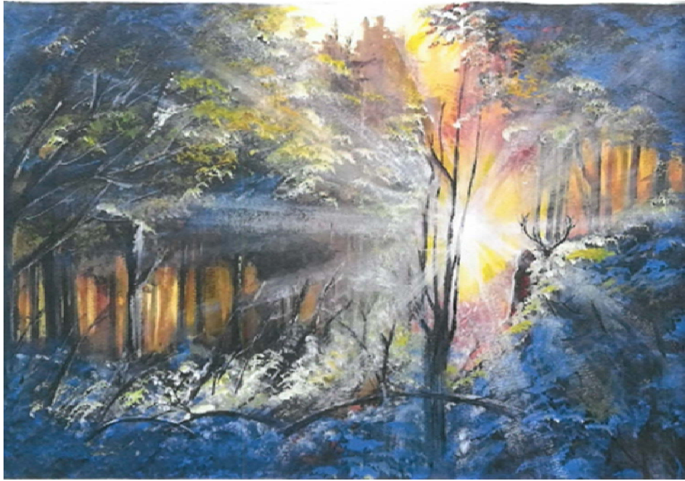
作品 1 秘境 塑膠彩 54 x 39 厘米